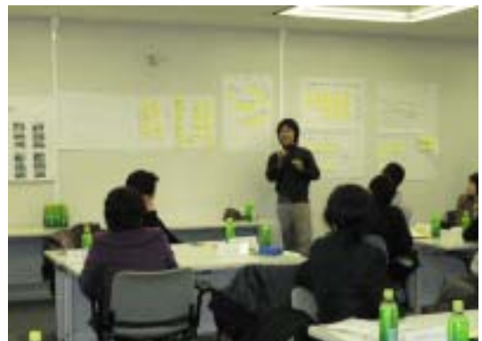
グループ毎に報告