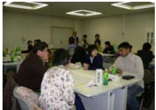
各言語でロールプレイ