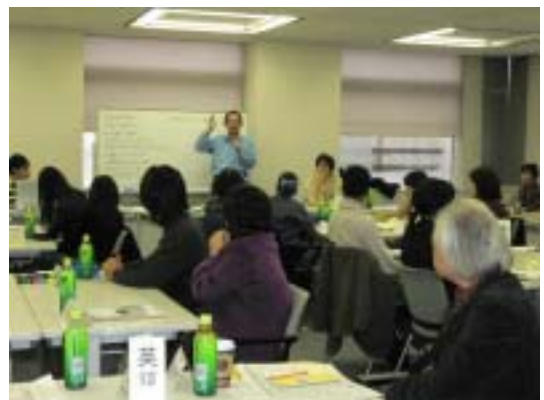
安藤副所長から説明