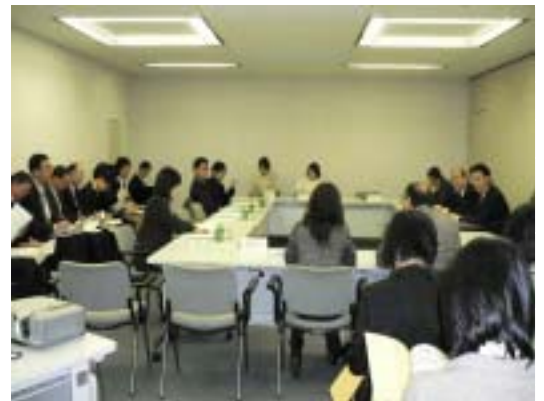
メディア連絡会の様子