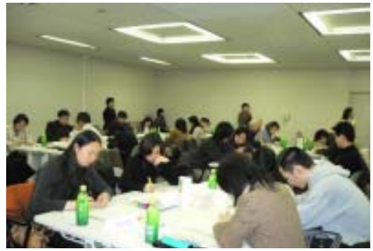
課題に対する回答をフセンに書く

今回の研修で、災害時に防災（語学）ボランティアとして円滑な活動を行うための基本的な知識を学んでいただけたと思います。来年度もさらに知識を増やしていただくための研修会を開催したいと考えております。