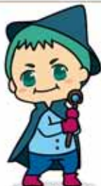
Thuật sĩ SHIN