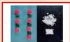
Chất kích thích

Sử dụng “ma túy <drug>”, sẽ làm cho tinh thần và cơ thể trở nên tệ đi. Sẽ có nhiều vấn đề với cơ thể xảy ra, trường hợp tệ nhất có thể chết người.