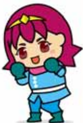
can đảm TOAN