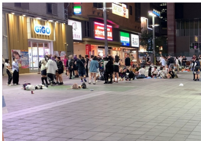
【シネシティ広場の様子（令和4年10月22日時点）】