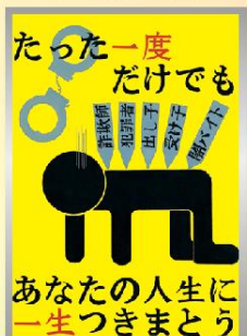
「特殊詐欺加担防止」 高校生の部