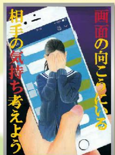
「インターネットのルールとマナー」 中学生の部