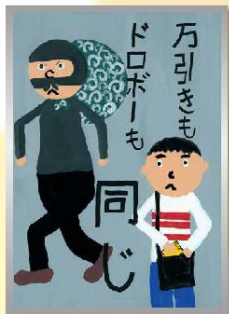
「万引き防止」 小学生低学年の部