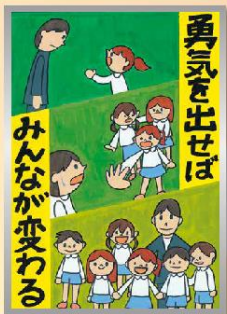
「いじめ防止」 小学生高学年の部