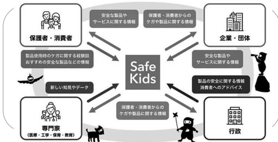
Safe Kids 概念図