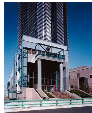
東京都写真美術館外観