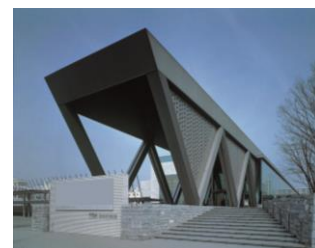
東京都現代美術館外観

都民が優れた現代美術を中心とする美術作品に接する場として、また創造・交流活動の場として、東京都現代美術館を設置し、運営している。