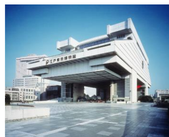
東京都江戸東京博物館外観

江戸東京の文化を保存し次代に継承するとともに、江戸東京の歴史を振り返り、これからの東京の都市と生活を考える場として東京都江戸東京博物館を設置し、運営している。