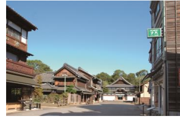
江戸東京たてもの園 下町中通りの街なみ

現地保存が不可能な文化的価値の高い歴史的建造物を移築し、復元、保存・展示した野外博物館である。収蔵建造物を貴重な文化遺産として次代に継承するとともに、建造物内部での生活民俗資料等の展示や、町並みの一端を再現することにより、変遷する建築文化や生活文化への都民の理解に資するために設置し、運営している。