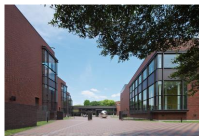
東京都美術館外観