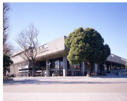
東京文化会館外観