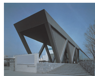
東京都現代美術館外観

都民が優れた現代美術を中心とする美術作品に接する場として、また創造・交流活動の場として、東京都現代美術館を設置し、運営している。なお、改修工事に伴い、平成31年3月下旬（予定）まで全面休館中。