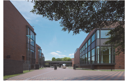
東京都美術館外観