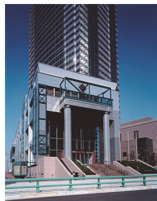
東京都写真美術館外観