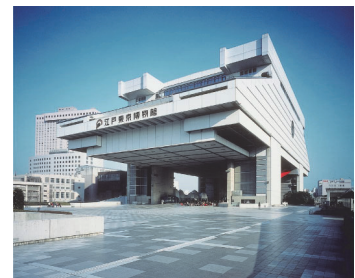
東京都江戸東京博物館外観