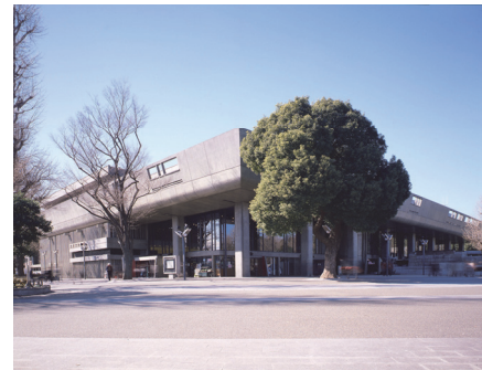
東京文化会館外観