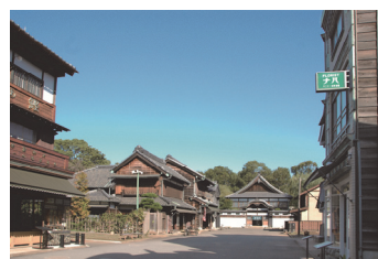
江戸東京たてもの園 下町中通りの街なみ

現地保存が不可能な文化的価値の高い歴史的建造物を移築し、復元、保存・展示した野外博物館である。収蔵建造物を貴重な文化遺産として次代に継承するとともに、建造物内部での生活民俗資料等の展示や、町並みの一端を再現することにより、変遷する建築文化や生活文化への都民の理解に資するために設置し、運営している。