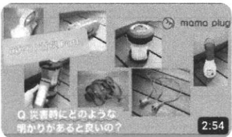
防災と明かりPart1「災害時にどのような明かりがあると良いの？」