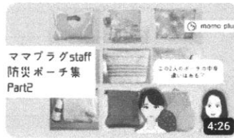
ママプラグスタッフ防災ポーチ集 part2