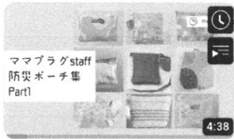
ママプラグスタッフ防災ポーチ集 part1