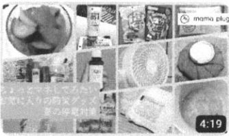
ちょっとマネしてみたいお気に入りの防災グッズ「夏の停電対策」