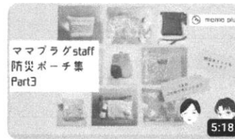
ママプラグスタッフ防災ポーチ集 part 3