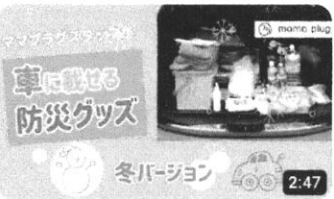
ママプラグスタッフが車に載せる冬の防災グッズ