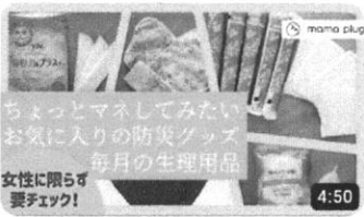
ちょっとマネしてみたいお気に入りの防災グッズ「毎月の生理用品」