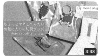
ちょっとマネしてみたいお気に入りの防災グッズ「かわいいホイッスル...」