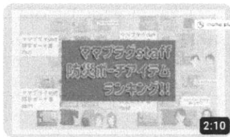
ママプラグスタッフ防災ポーチアイテムランキング