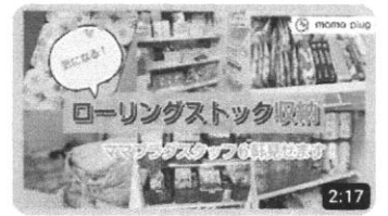
気になる！ローリングストック「収納」ママプラグスタッフ6野見せ...