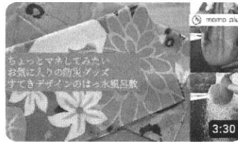
ちょっとマネしてみたいお気に入りの防災グッズ「すてきデザインの...」