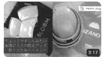
ちょっとマネしてみたいお気に入りの防災グッズ「折りたたみヘルメット...」