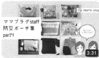
ママプラグスタッフ防災ポーチ集 part 4