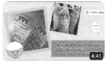
ちょっとマネしてみたいお気に入りの防災グッズ「ハイゼックス炊飯...」