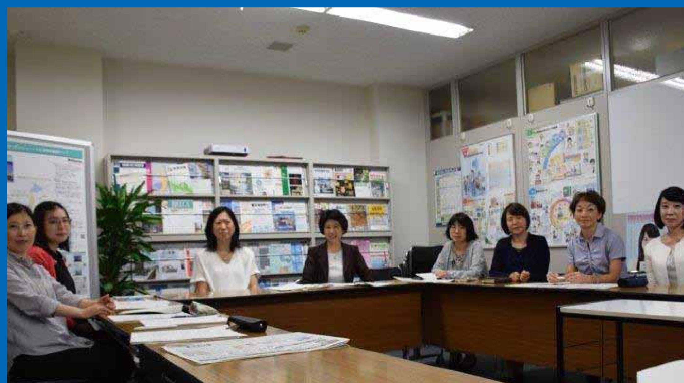
設備女子会運営委員会・事務局の皆さん