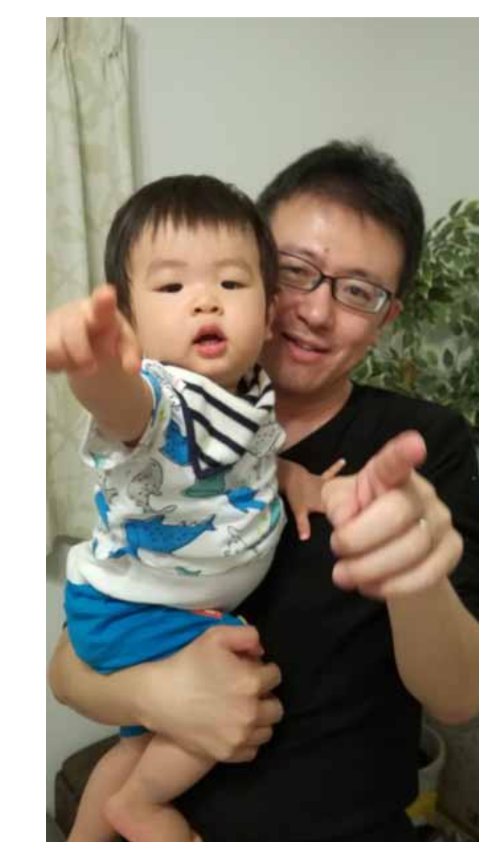
子育て中男性社員