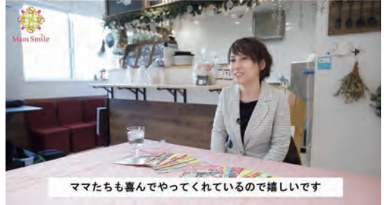
ママたちも喜んでやってくれているので嬉しいです