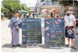
【写真：学校法人野上学園 久我山幼稚園前】

～社会福祉法人風の森～男性保護者コミュニティ「チームパパ」 子供たちを笑顔に！パパの人生を豊かに！