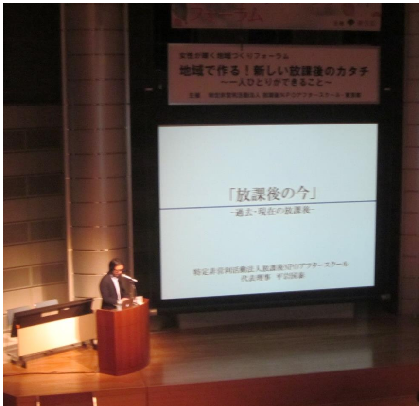
【オープニングトーク】