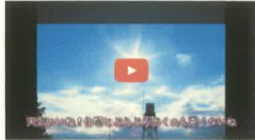
中3勉強会の作品『杉並ぶらり旅』