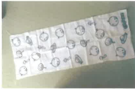
関係者・協力者等にくばられた「はじっこまつり手ぬぐい」(左)