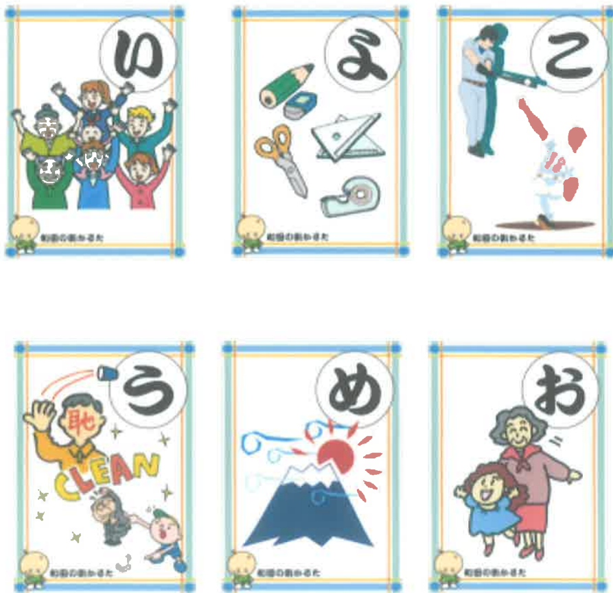
A4サイズで作成された「和田の街かるた」