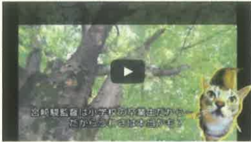
津田芽衣さんの作品『トレと穿衣の杉並案内』